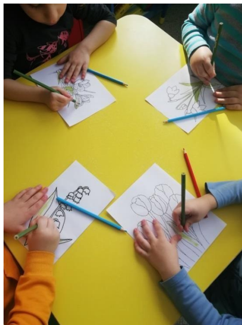
Раскрашивание раскрасок «Первоцветы»