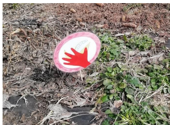
Акция «Не рвите первоцветы»