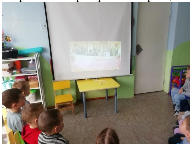
Знакомство со сказкой «Как поссорились первоцветы»