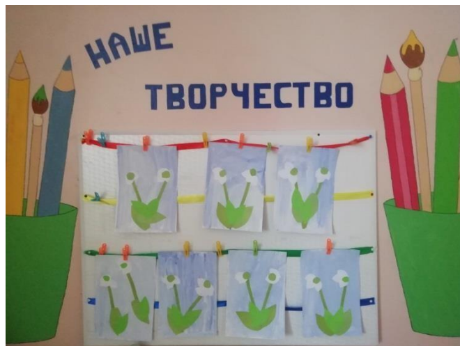
Аппликация «Подснежник на проталинке»