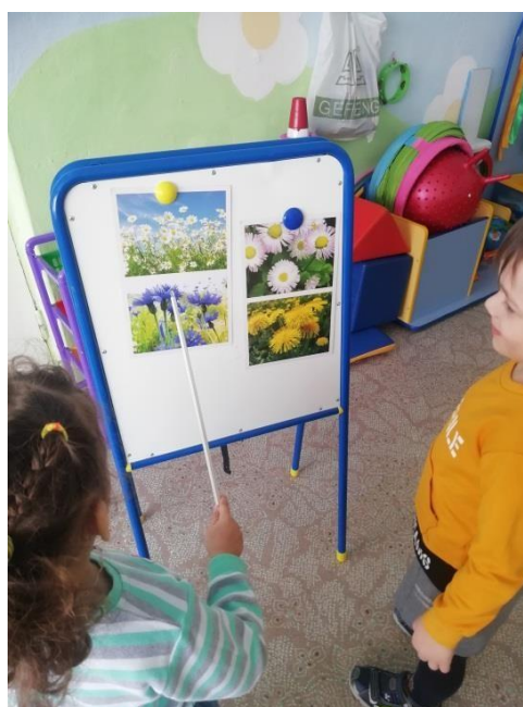
Словесная игра «Узнай по описанию»